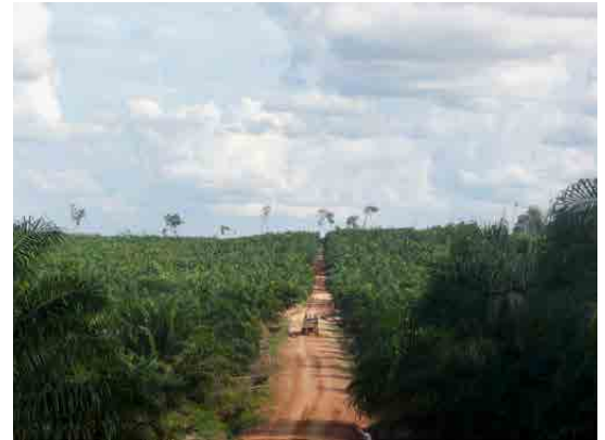
Sammelfrucht der Ölpalme (links), Ölpalmpflanzung

und ökologisch ausgewogene Landnutzung anpeilen. Gute Beispiele liefern dafür Bauerngenossenschaften auf der benachbarten Insel Java, wo erfolgreich eine intensive Mischkultur mit Holzproduktion, Gemüse- und Früchteanbau im Sinne der «Agroforestry» gepflegt wird.