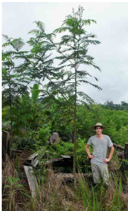
Paraserianthes falcataria sechs Monate (oben) bzw. 2–3 Jahre nach der Pflanzung

Allzu viel ist über diese Baumart sonst nicht bekannt, doch man kann auf einige Versuchsflächen in Indonesien zurück-