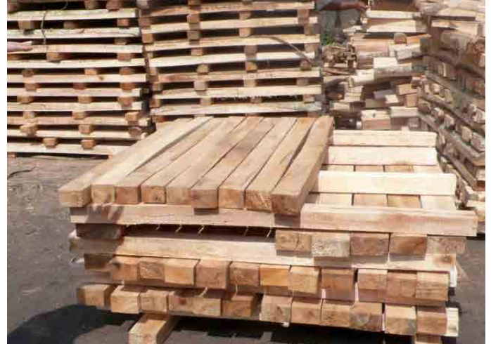
Der Absatz des äusserst schnell wachsenden Leichtholzes ist gesichert und ermöglicht bei den billigen lokalen Arbeitskräften durchaus hohe Nettoerträge von zurzeit je nach Durchmesser zwischen CHF 30.– und 50.–/m 3 !

greifen, die von finnischen Wissenschaftlern erarbeitet wurden (Center of International Forestry Research CIFOR in Bogor; Krisnawati, Varis et al. , 2011). Sie stellten auf allerdings sehr fruchtbaren und vulkanisch geprägten Böden eine erstaunliche Wuchsleistung fest: Innert 10 Jahren sind 18 bis 28 m Baumhöhe möglich, der Holzzuwachs übersteigt 50 m 3 /ha und Jahr! Allerdings darf man nicht vergessen, dass es in diesem feucht-warmen tropischen Klima kaum Jahreszeiten gibt und die Pflanzen dauernd wachsen.