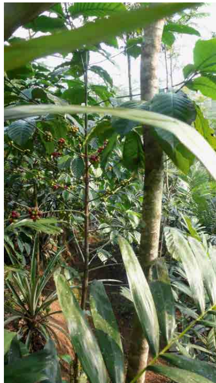
Agroforestry auf Java

Zusammenfassend kann gesagt werden, dass das Projekt «1m Trees» eine wachsende Anzahl lokaler Bauern für den alternativen Anbau von Albizia gewinnen konnte. Das Hörensagen unter den Bauern hat eine gewisse Dynamik ausgelöst, die an sich sehr erwünscht ist, aber für das Projekt auch die Verpflichtung einer intensiveren und anhaltenden Begleitung der Teilnehmer einschliesst. Kein Dayak ist von Haus aus Waldbauer, und die Waldgesinnung muss zunächst durch Beispiele und eigene Erlebnisse geschaffen werden. Eine edle, aber auch langwierige didaktische Aufgabe.